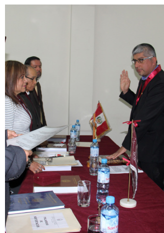
Doctores juramentan trabajar con ética.

Se espera a mediano plazo potenciar esas materias y convertirlas en maestrías que, junto con una maestría en Supply Chain Management y otra en Gestión de Operaciones, amplíen la oferta educativa del Posgrado de la FIIS que actualmente ofrece la Maestría en Cien-