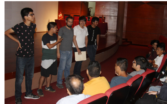
Cachimbos ya ensayan salir al frente y dirigirse al público.

Los directores de las escuelas de la FIIS también dedicaron unos momentos a los ingresantes para indicarle los razgos generales de los planes de estudios y los recursos que facilitan el aprendizaje, como son los laboratorios, las aulas equipadas con computadoras, la biblioteca, el auditorio, etc.. Describieron a la FIIS y a la UNI y presentaron los retos para el futuro: posicionarse entre las mejores uni-