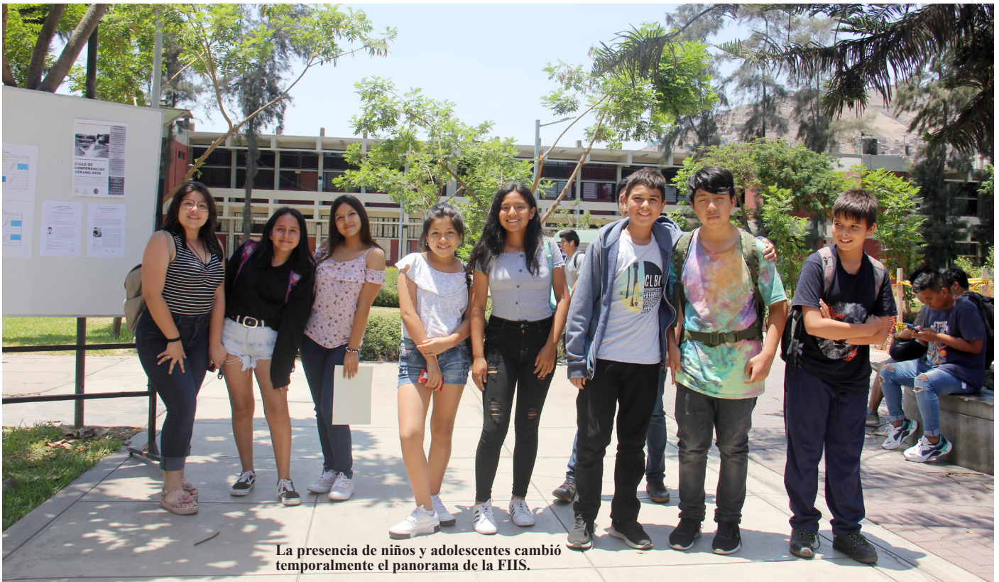
La presencia de niños y adolescentes cambió temporalmente el panorama de la FIIS.