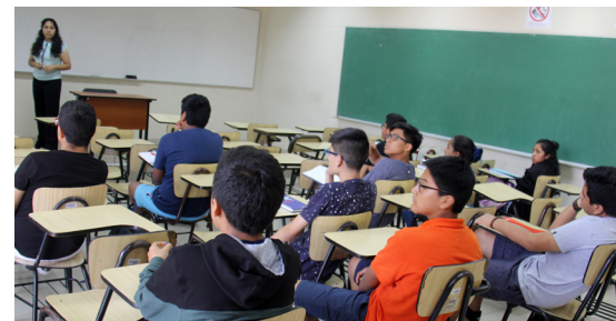
Los alumnos de secundaria recibieron clases en aulas de la FIIS.

Los profesores fueron alumnos destacados de esta Facultad, compañeros de ciclos avanzados con amplio conocimiento de las materias encargadas y provistos de las capacidades de comunicación, liderazgo, simpatía y paciencia que se necesita para la educación de niños