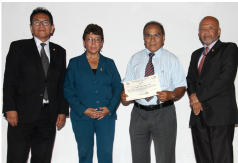
Mg. Córdova recibió diploma de autoridades de la FIIS.

Este sistema permitirá a las autoridades de la Facultad hacer un monitoreo en tiempo real de las incidencias en aula: presencia del docente, asistencia de los alumnos, puntualidad, abandono del aula, etc.