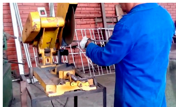
Propuesta de los estudiantes de la FIIS es innovadora y práctica.

La función principal de este aparato es sujetar la pieza sobre la que se hacen las operaciones. De acuerdo con sus creadores, su principal beneficio es que evita los reprocesos, porque si el dispositivo no tiene un buen agarre, el maquinado al final sale mal y eso va a generar reprocesos que significarán aumentos de costos de fabricación. Su característica especial es el pistón, que ejerce la fuerza para poder sujetar la pieza que se maquiniza.