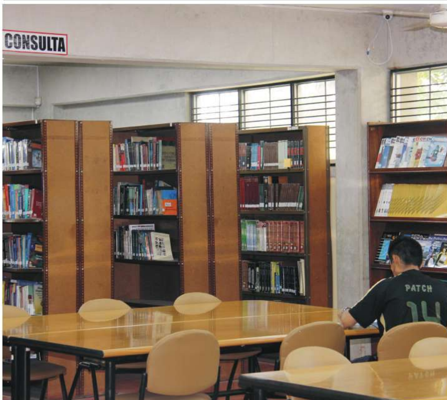
El CIFIIS cuenta con 10,945 libros y 3,057 tesis e informes profesionales de los graduados de nuestra Facultad.