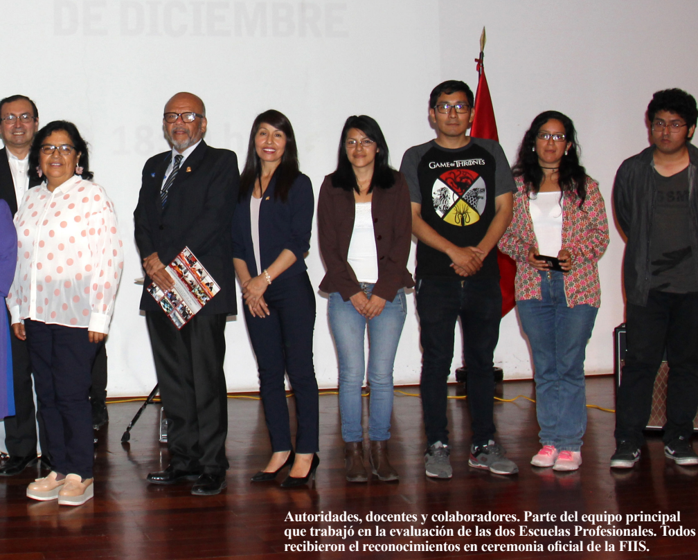
Autoridades, docentes y colaboradores. Parte del equipo principal que trabajó en la evaluación de las dos Escuelas Profesionales. Todos recibieron el reconocimientos en ceremonia oficial de la FIIS.