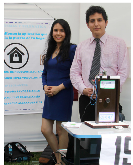
Correctamente vestidos, los estudiantes hicieron muy buena exposición de sus trabajos innovadores.