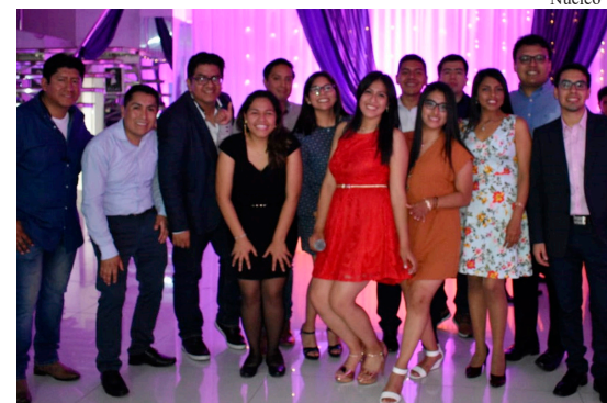
Encuentro de generaciones. Presidentes de Núcleo en el tiempo.

La revista ya es emblemática de la FIIS. En el año de sus Bodas de Plata acaba de ganar el premio "Equipo Summit 2019" en la categoría Economía y Negocios. Más motivos para festejar. ●