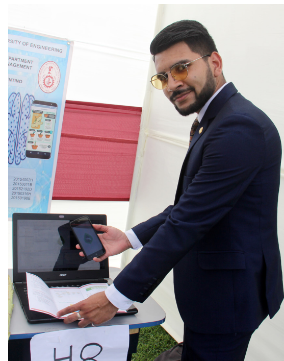
Demstración del aplicativo Project Gardant, proyecto ganador.