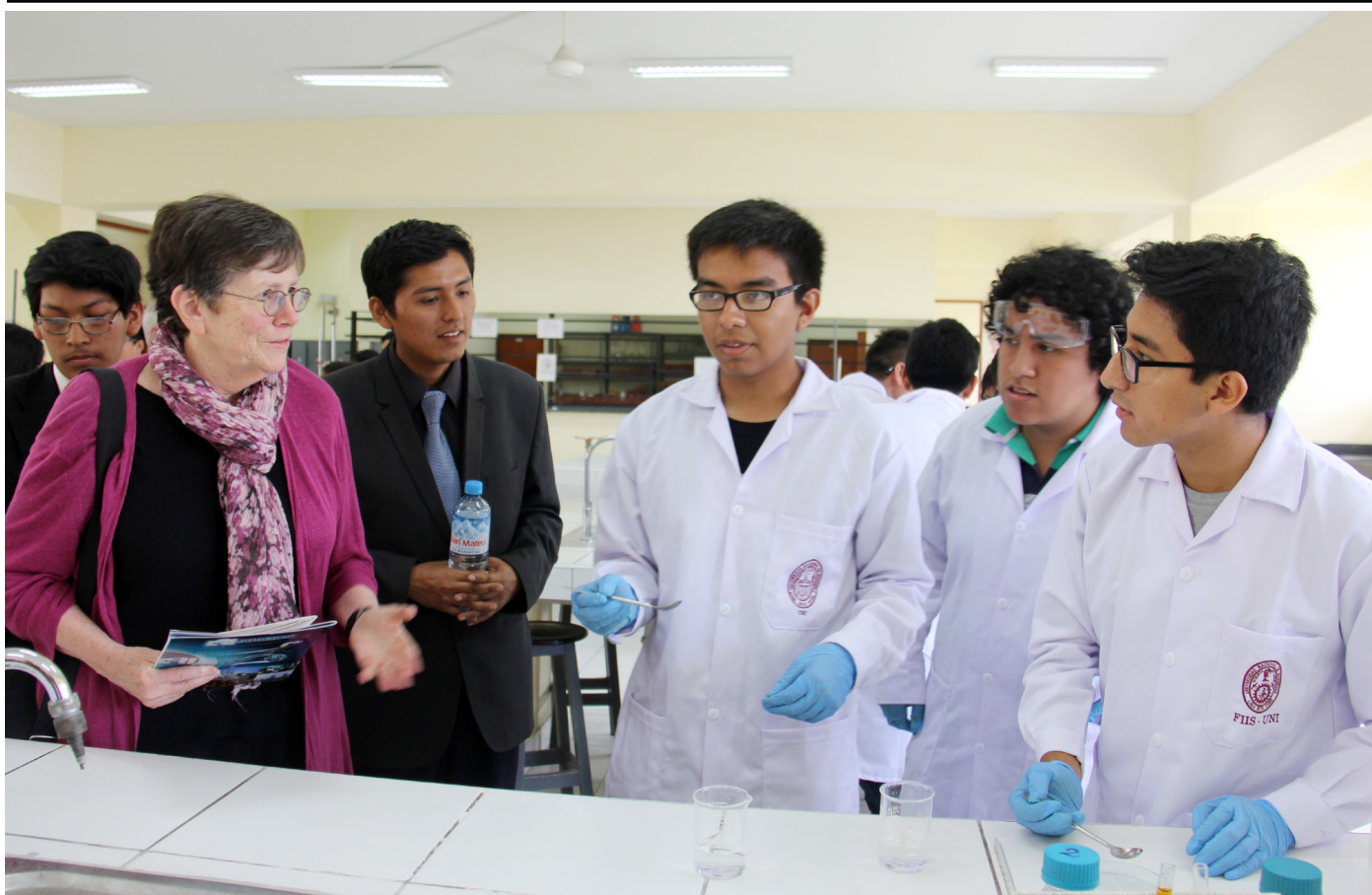
En el Laboratorio de Química los evaluadores presenciaron las prácticas de un grupo de estudiantes cuando comprobaban la Ley de Boyle. Visita fue satisfactoria.