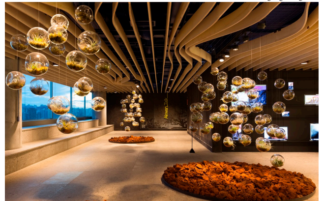
Ingreso a la sala de Google en el piso 16 de la sede en Belo Horizonte.