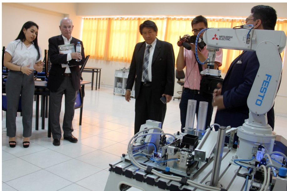
La modernidad de los laboratorios y sus equipos causaron buena impresión a los visitantes de ABET.

Los evaluadores pasaron poco después a las oficinas que les fueron acondicionadas y procedieron con la revisión de la documentación archivada en los portafolios. Empezaron la búsqueda en los papeles de evidencias que comprueben la excelencia académica de cada Escuela.