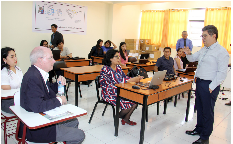
En el aula de Inteligencia Artificial los evaluadores escucharon una clase muy dinámica dictada en inglés.