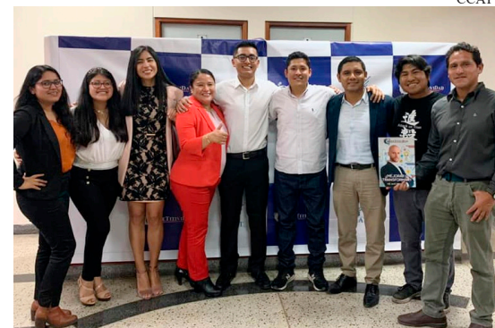
Autores de la revista Competitividad y amigos celebran el éxito.