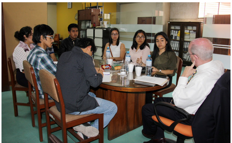
Entrevista con estudiantes participantes en proyectos de investigación y en concursos de programación.

y anécdotas de los tres días de evaluación y se cerró a ritmo de fiesta con un espectáculo rockero a cargo de un grupo de estudiantes de la FIIS.